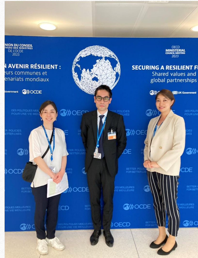
OECD日本政府代表部 元専門調査員