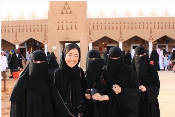
在サウジアラビア大使館 元専門調査員