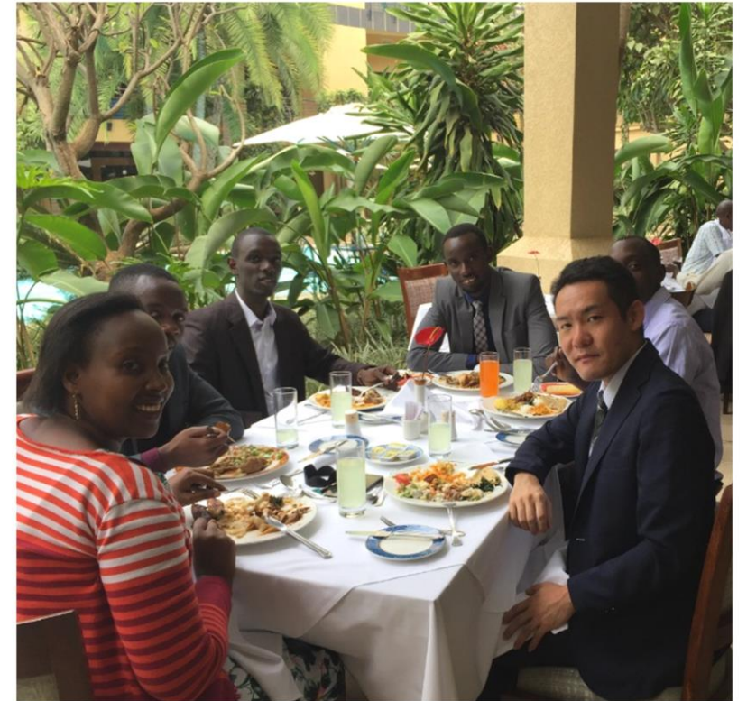
在ルワンダ大使館 元専門調査員