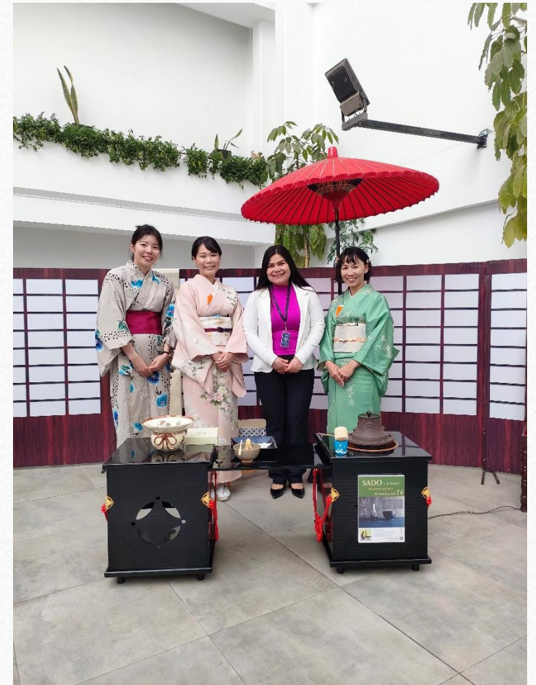
在ポリビア大使館 専門調査員