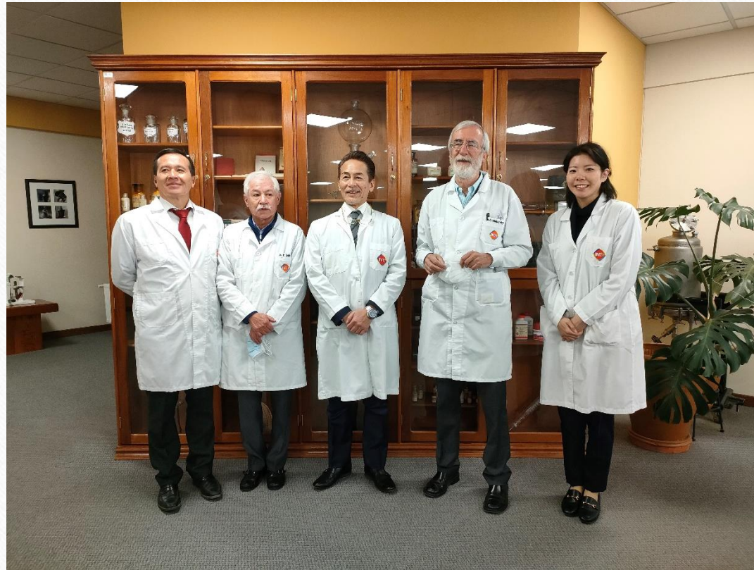
在ポリビア大使館 専門調査員