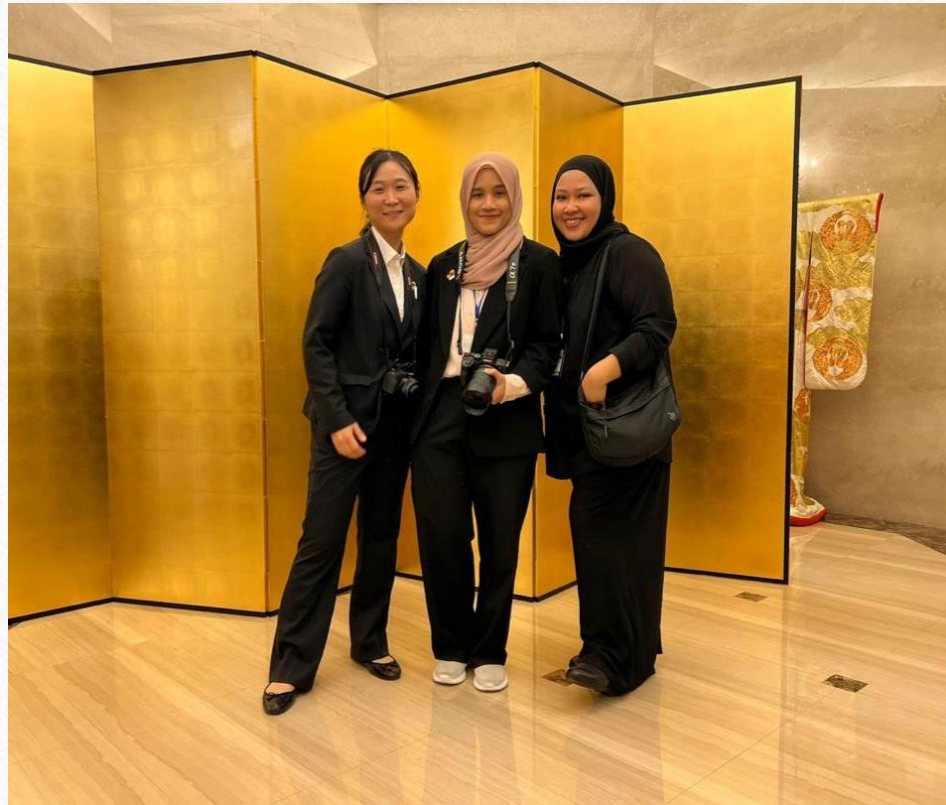
在マレーシア大使館 元専門調査員