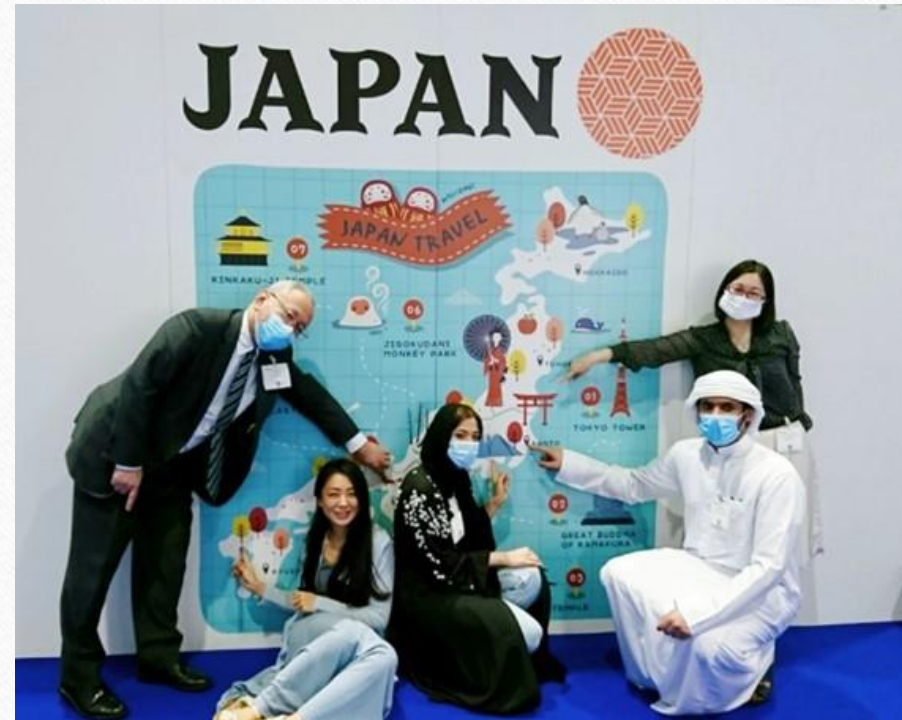
在アラブ首長国連邦大使館 元専門調査員