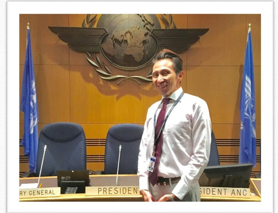
ICAO日本政府代表部 元専門調査員