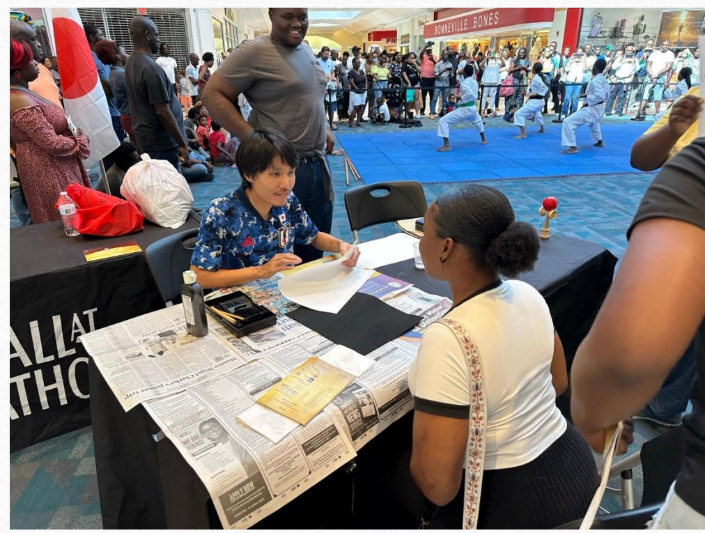
在ジャマイカ大使館 元専門調査員