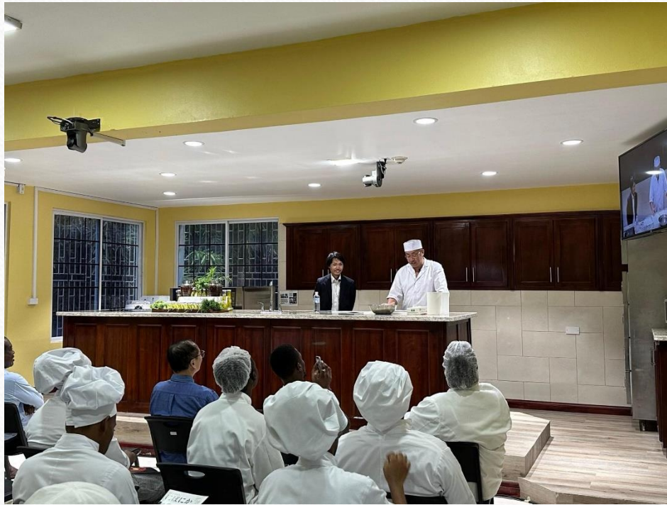
在ジャマイカ大使館 元専門調査員