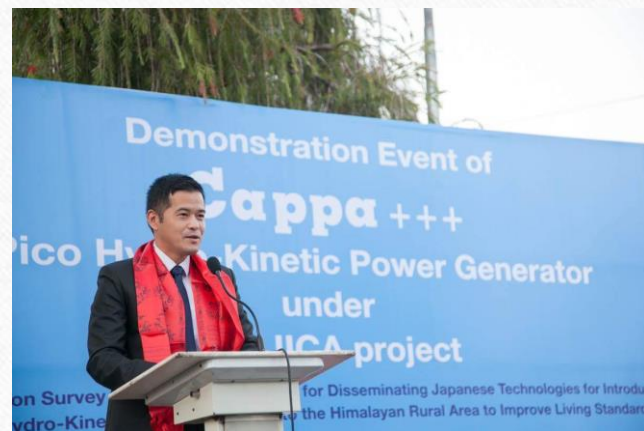
在ネパール大使館 元専門調査員